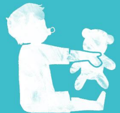
Risikogruppe: Neugeborene, Säuglinge & Kleinkinder