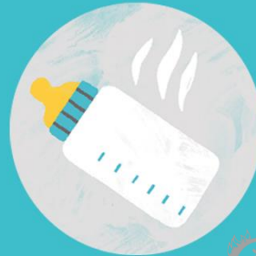
Fläschchen/Brei aus der Mikrowelle