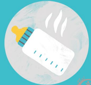
Fläschchen/Brei aus der Mikrowelle