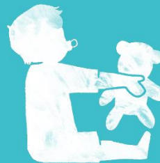
Risikogruppe: Neugeborene, Säuglinge & Kleinkinder